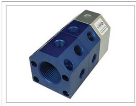
Puerto a Blanco (PB)

Color: Rojo/Plata o Azul/Plata # de Entradas: Una # de Salidas: (25) Máx. # de Bloque: (6) Máx.