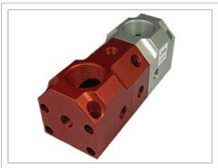
Puerto a Puerto 90° (PP)

Color: Rojo/Plata o Azul/Plata # de Entradas: Una en cada extremo # de Salidas: (21) Máx. # de Bloque: (5) Máx.