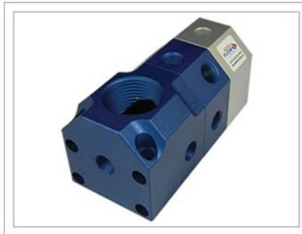
Puerto a Blanco 90° (PB)

Color: Rojo/Plata o Azul/Plata # de Entradas: Una # de Salidas: (23) Máx. # de Bloque: (6) Máx.