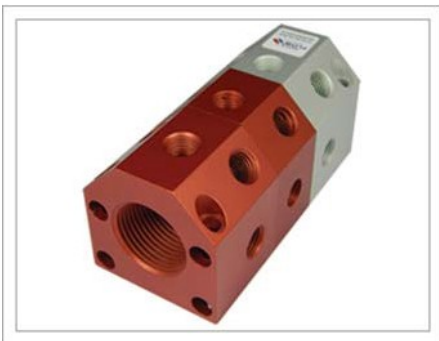
Puerto a Puerto (PP)

Color: Rojo/Plata o Azul/Plata # de Entradas: Una en cada extremo # de Salidas: (25) Máx. # de Bloque: (5) Máx.