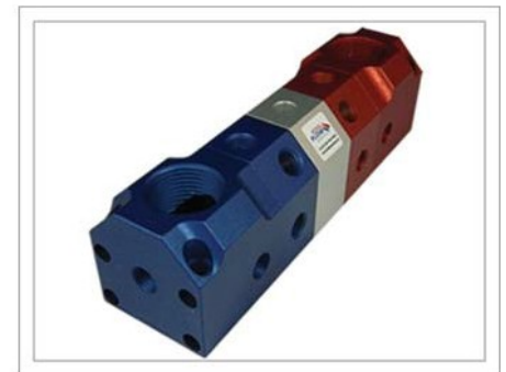
Puerto a División 90° (PD)

Color: Rojo/Plata/Azul # de Entradas: Una en cada extremo # de Salidas: (46) Máx. # de Bloque: (11) Máx.