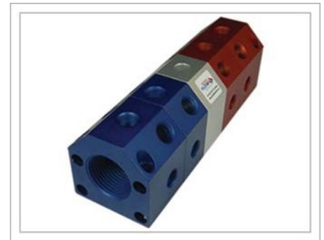
Puerto a División (PD)

Color: Rojo/Plata/Azul # de Entradas: Una en cada extremo # de Salidas: (50) Máx. # de Bloque: (11) Máx.